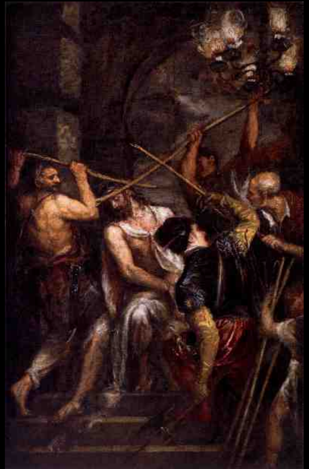
Titien, Le Couronnement d'épines , 1572-1576, huile sur toile, 280 x 181 cm, Munich, Alte Pinakothek