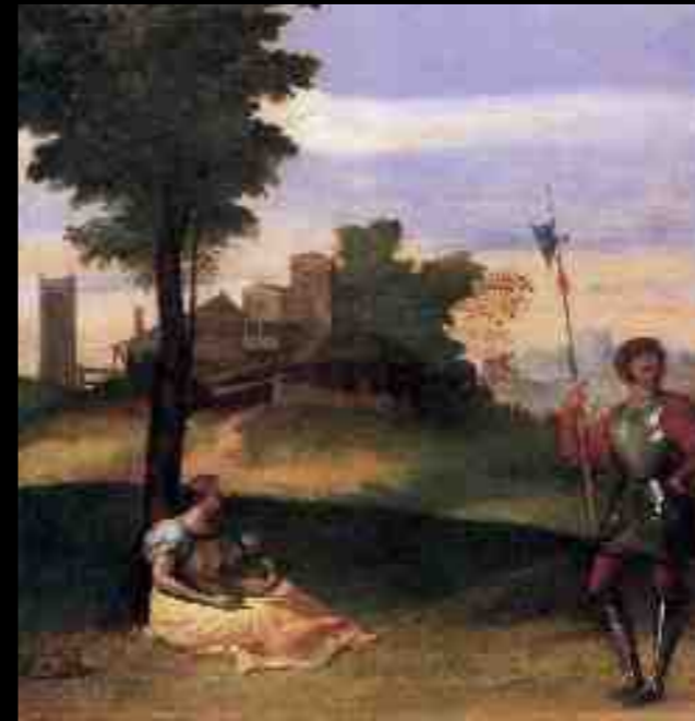
Titien, Idylle rustique , 1507-1508, huile sur bois, 46 x 44 cm, Cambridge, Fogg Art Museum