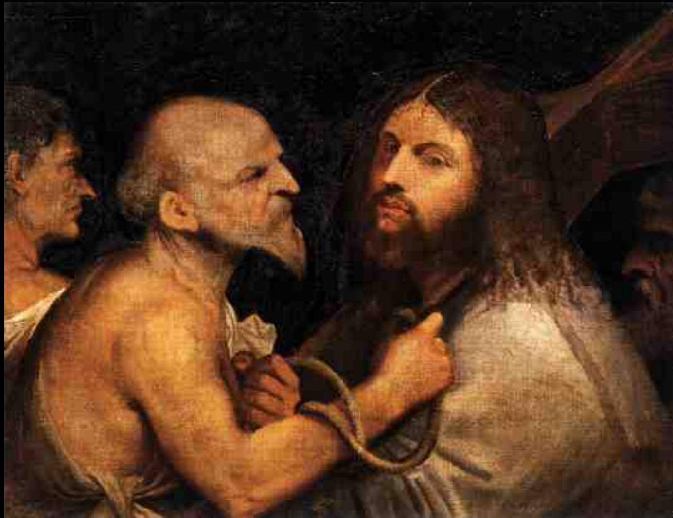
Titien, Le Portement de croix , v. 1506-1507, huile sur toile, 70 x 100 cm, Venise, Scuola di S. Rocco