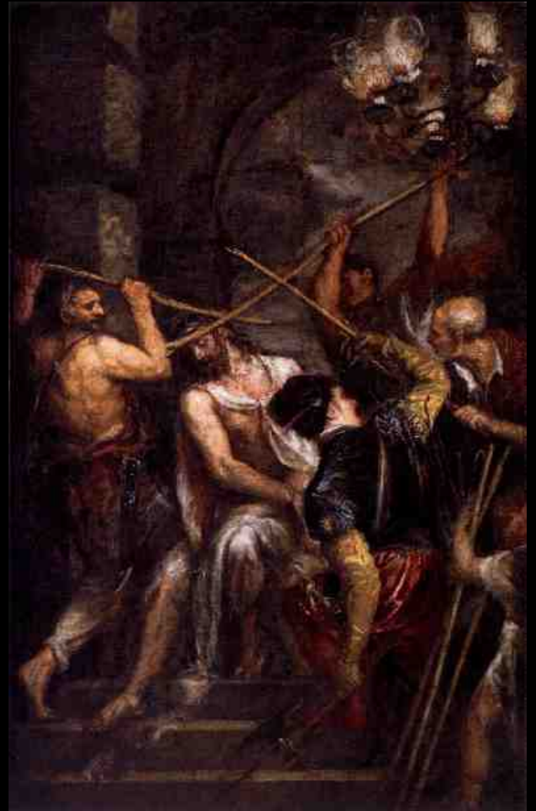
Titien, Le Couronnement d'épines , 1572-1576, huile sur toile, 280 x 181 cm, Munich, Alte Pinakothek