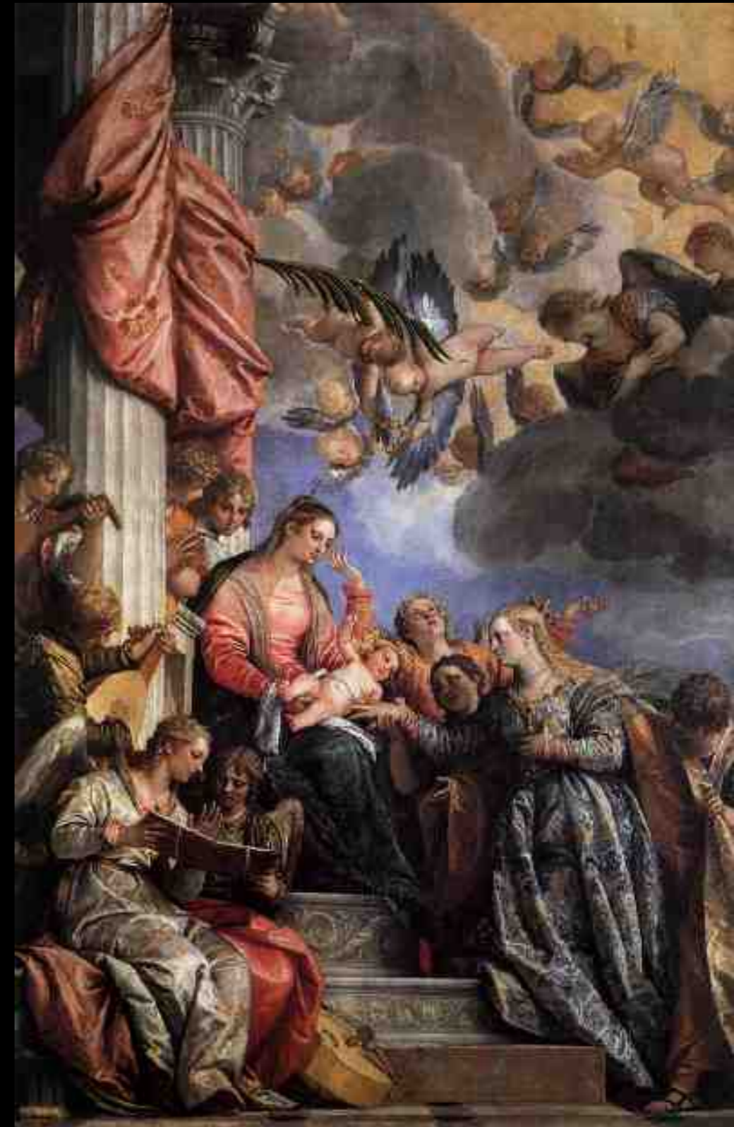
Paul Véronèse, Le Mariage mystique de sainte Catherine , v. 1575, huile sur toile, 337 x 241 cm, Venise, Galleria dell'Accademia