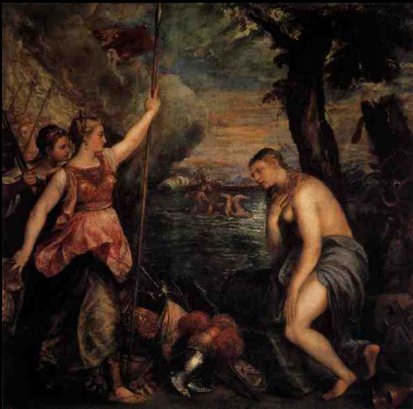
Titien, L'Espagne secourant la Religion , v. 1575, huile sur toile, 168 x 168 cm, Madrid, Museo del Prado