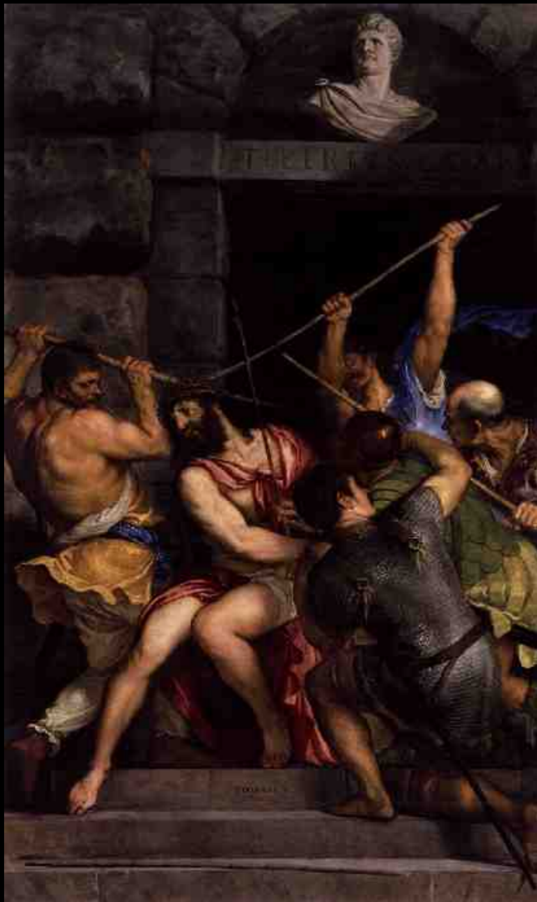
Titien, Le Couronnement d'épines , 1542, huile sur bois, 303 x 181 cm, Paris, musée du Louvre