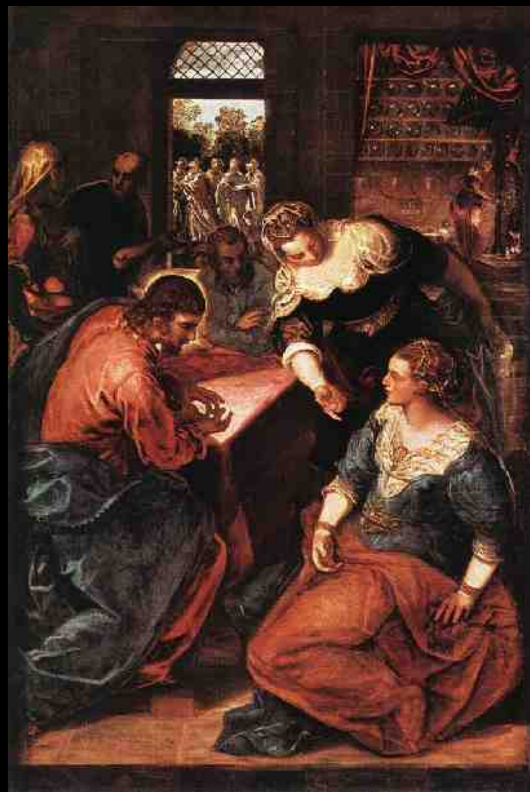
Tintoret, Le Christ dans la maison de Marthe et Marie , 1570-1575, huile sur toile, 200 x 132 cm, Munich, Alte Pinakothek