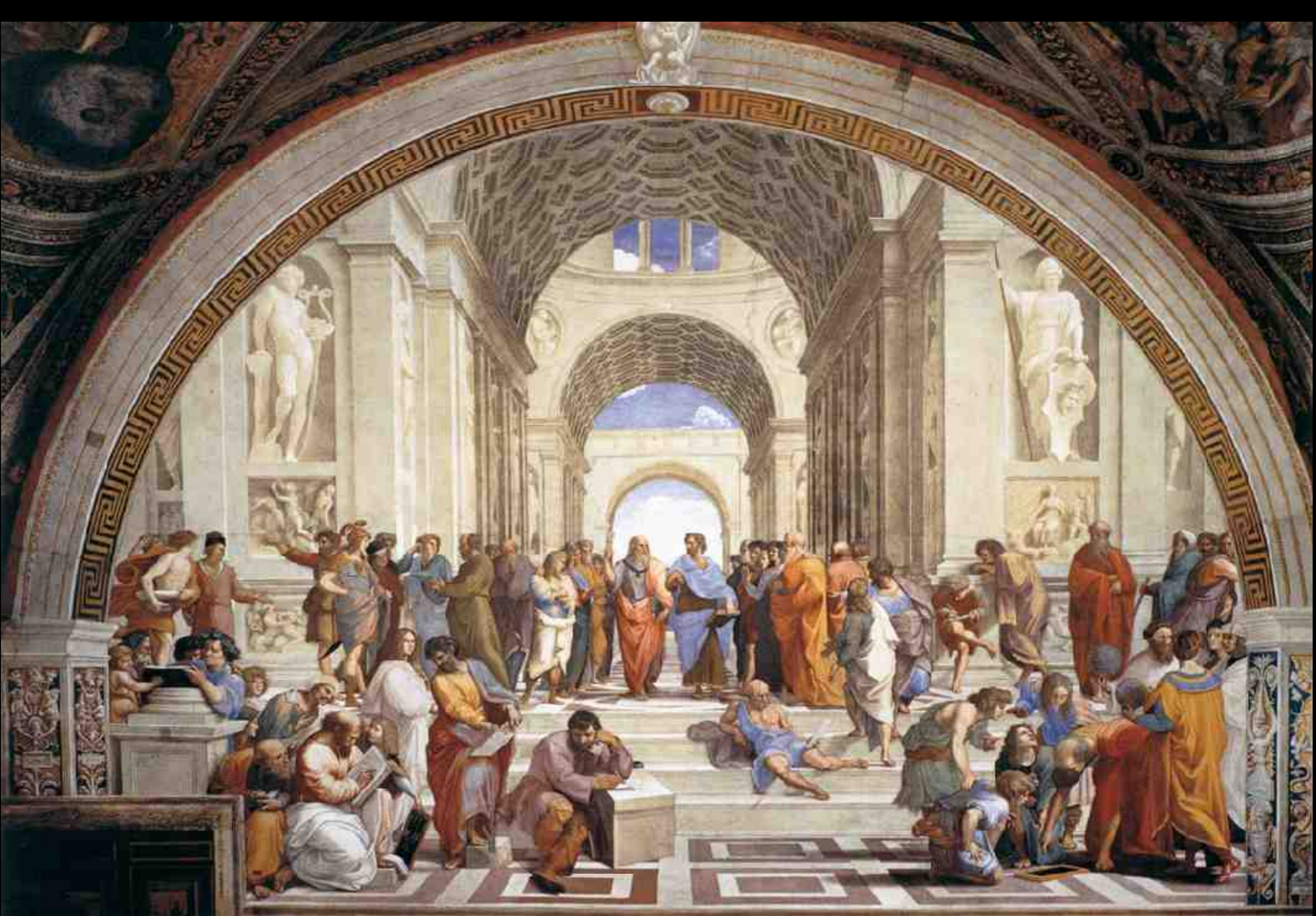
Raphaël, L'École d'Athènes , 1509, fresque, 770 cm (largeur), Vatican, Stanza della Segnatura