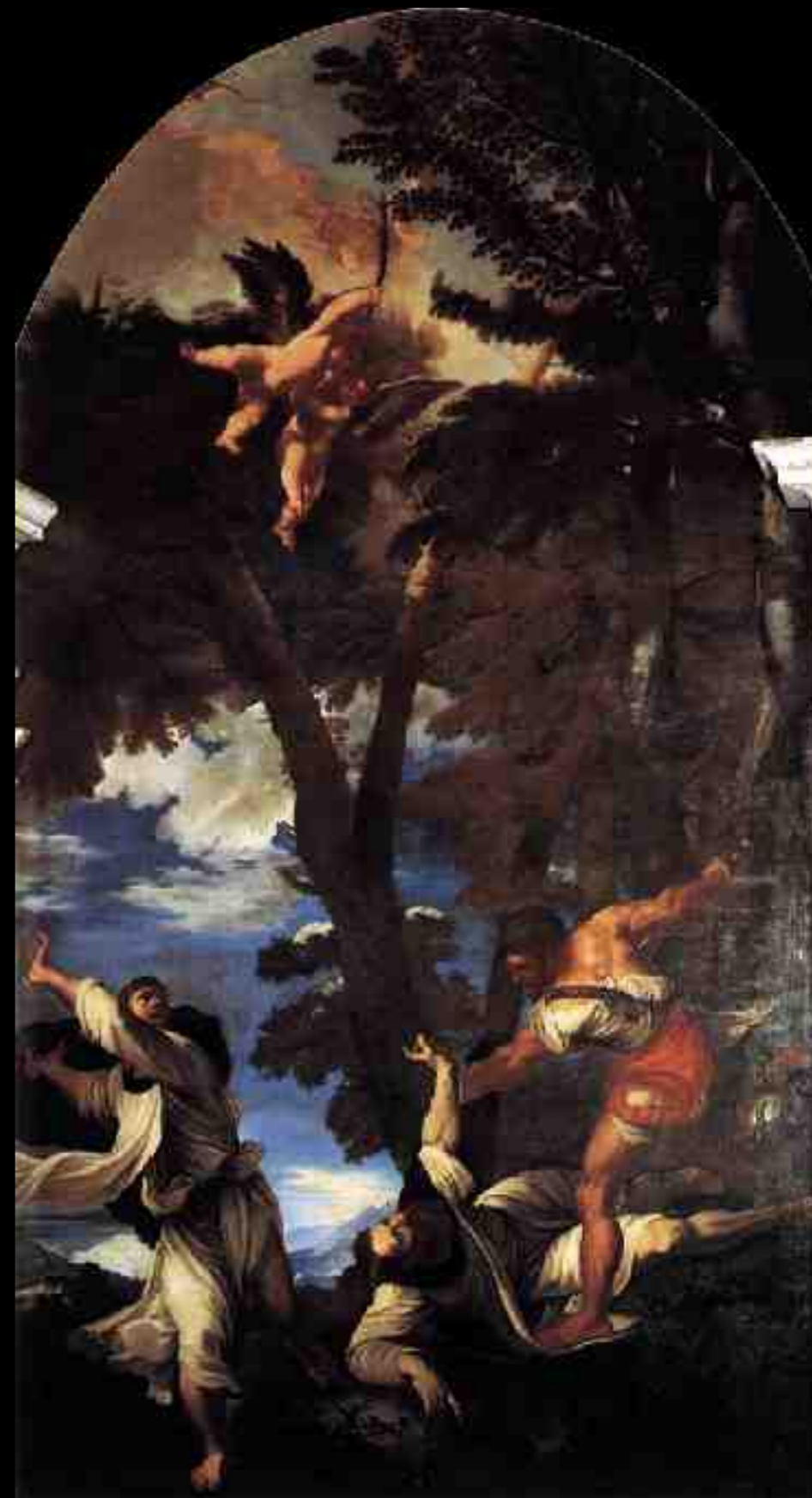
Titien, La Mort de saint Pierre de Vérone , 1527-1529, huile sur toile, 500 x 306 cm, Venise, SS. Giovanni e Paolo