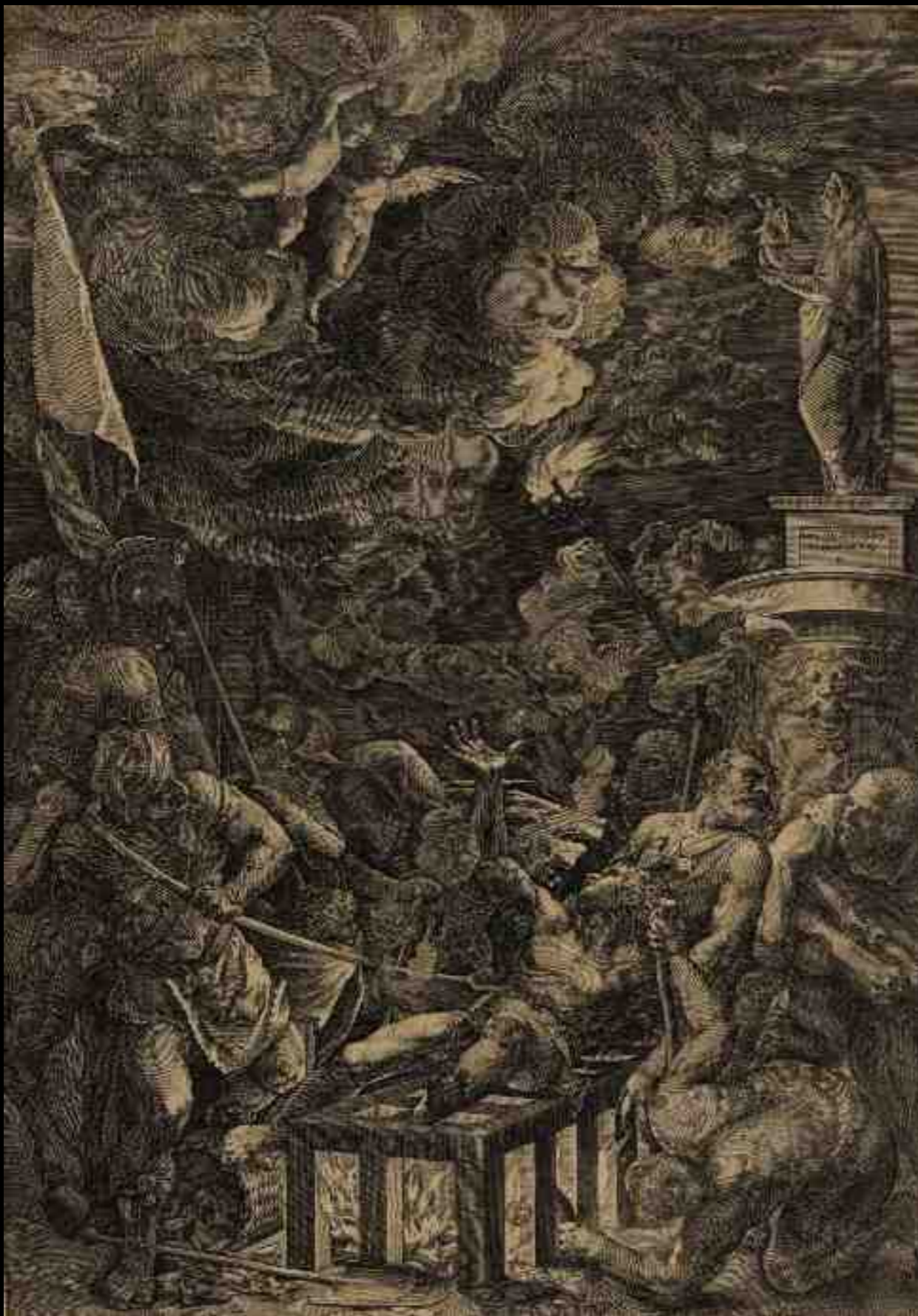
Cornelis Cort d'après Titien, Le Martyre de saint Laurent , 1571, burin, 34,7 x 49,5 cm