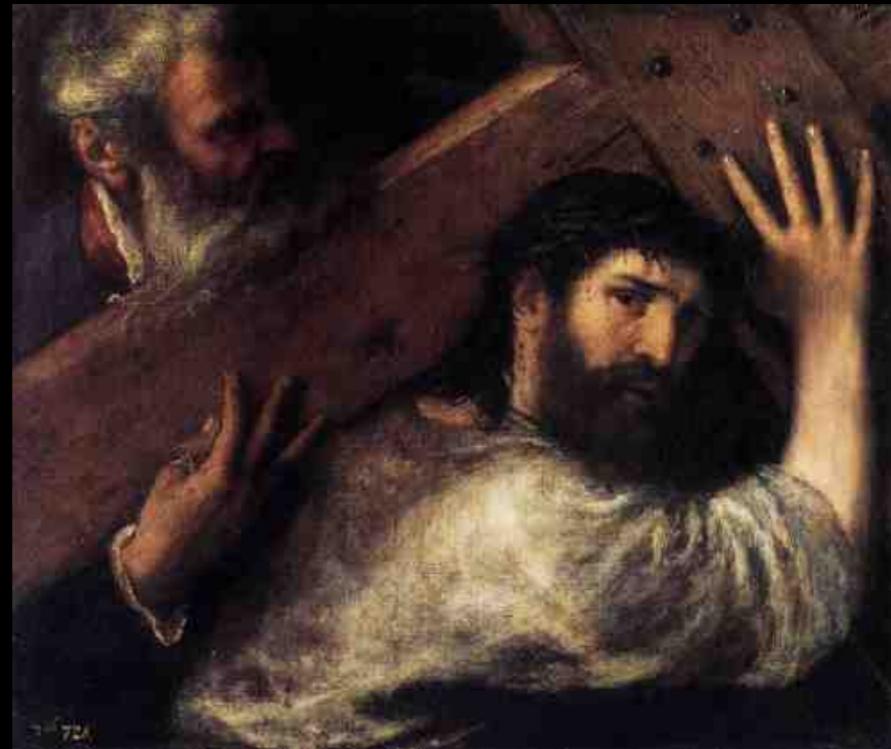
Titien, Le Portement de croix , v. 1570-1575, huile sur toile, 67 x 77 cm, Madrid, Museo del Prado