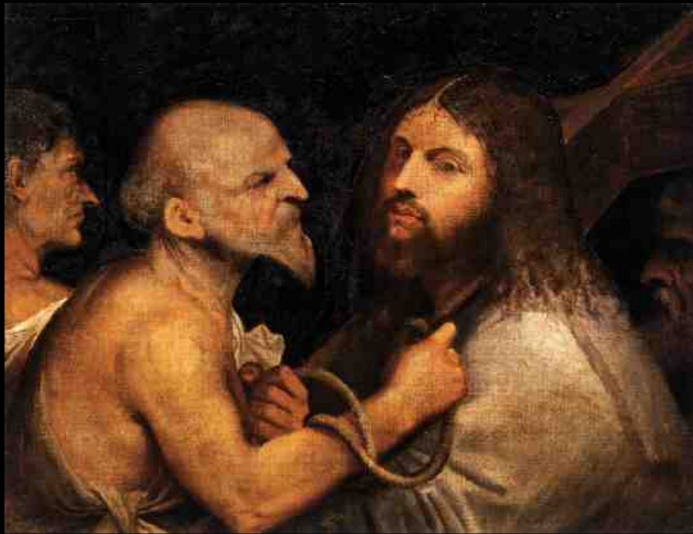
Titien, Le Portement de croix , v. 1506-1507, huile sur toile, 70 x 100 cm, Venise, Scuola di S. Rocco